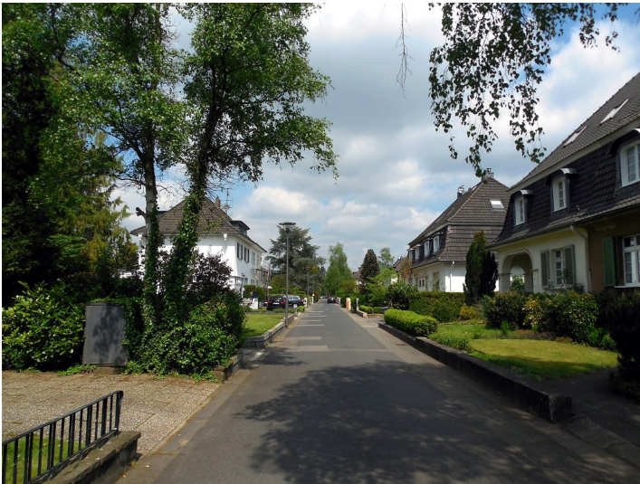
Wohnstraße mit Doppelhäusern in der "Göttersiedlung" in Köln-Rath/Heumar (2015)