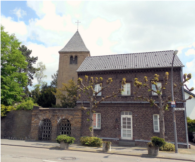
Kapelle an der Eiler Straße in Köln-Rath/Heumar (2015)