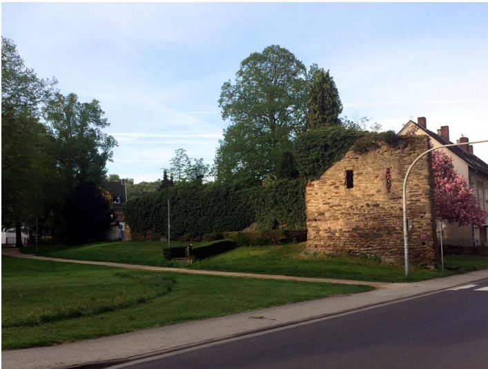
Erhaltene Reste der Sinziger Stadtbefestigung (2018)