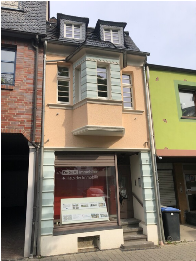
Wohn- und Geschäftshaus Ausdorferstraße 9 in Sinzig (2022)