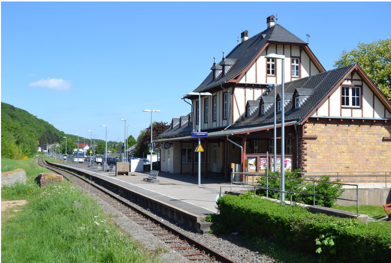
Der Bahnhof von Bad Münstereifel