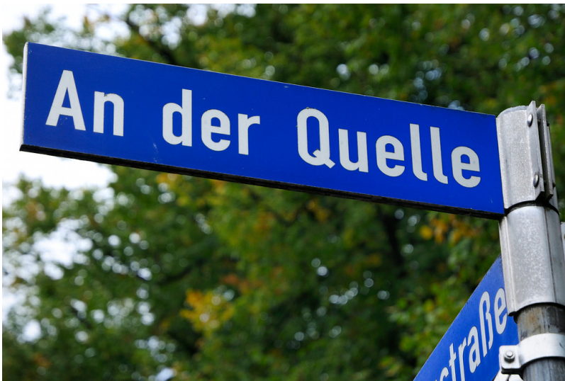
Straßenschild "An der Quelle" in Nettetal-Kaldenkirchen (2013).