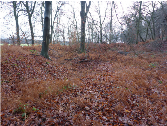
Senke im Wald am Wolfsberg (2021)