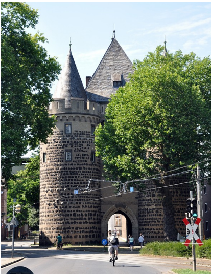
Das Obertor in Neuss (2017), Ansicht der stadtausseren Seite, zugleich früherer Standort des Augustiner-Chorherrenstifts Neuss.