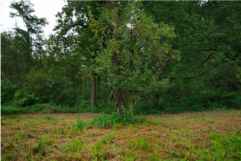
Quellbereich westlich des Meerhofes bei Meerbusch-Strümp im Sommer 2014.