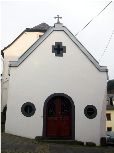
Pestkapelle Sankt Sebastian und Rochus in Sayn (2015)