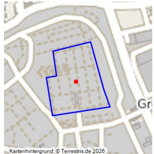
Lageplan des Nordfriedhofs Düsseldorfs, darin ist die Parzelle des Neuen Jüdischen Friedhofs als "Israelitischer Friedhof" ausgewiesen (2015). Der Alte jüdische Friedhof an der Uhlmannstraße liegt nur rund 200 Meter südöstlich des Nordfriedhofs.

Seit Mitte des 17. Jahrhunderts lebten Juden kontinuierlich in Düsseldorf und seit um 1700 sind hier mehrere jüdische Friedhofsstandorte überliefert. In der Landeshauptstadt besteht u.a. noch der „Neue“ jüdische Friedhof auf dem Nordfriedhof. Sein Gegenstück ist der als „ Alter jüdischer Friedhof “ bezeichnete ehemalige Begräbnisplatz etwa 700 Meter südöstlich in der Uhlmannstraße.