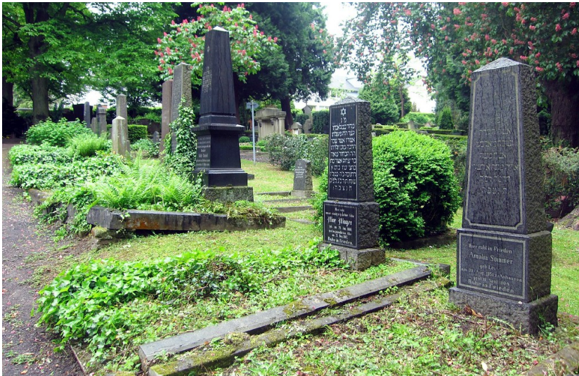
Gräberreihe auf der jüdischen Abteilung des Burgfriedhofs in Bonn-Bad Godesberg (2014)