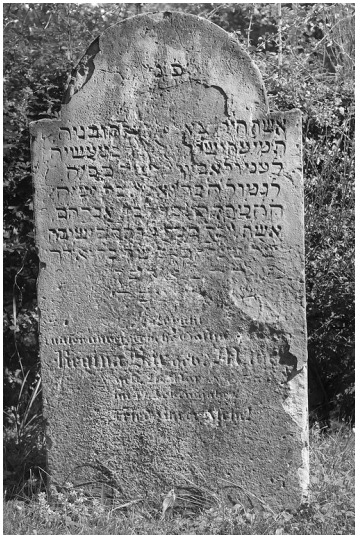
Grabstein auf dem Jüdischen Friedhof Arloff-Kirspenich, Bad Münstereifel.