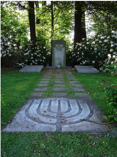
Gedenkstätte mit Gedenkstein auf dem Bereich des in der NS-Zeit zerstörten und eingeebneten jüdischen Friedhofs Alsdorf auf dem Areal des heutigen Nordfriedhofs (2020).