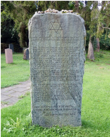
Der im Jahr 1991 von der Gemeinde errichtete Gedenkstein auf dem Judenfriedhof am Hühnerbuschweg in Alfter (2024).