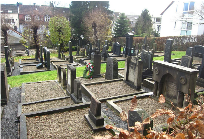
Gräberreihen auf dem jüdischen Friedhof an der Hugostraße in Barmen (2014).