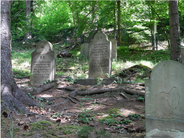
Jüdischer Friedhof im Queckenwald, Bad Münstereifel (2014)