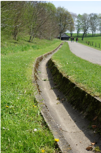
Regenwassersammelrinne am Igeler Hof (2017)