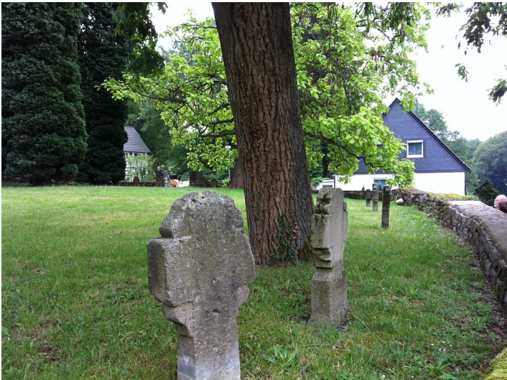
Alter Kirchhof in Sand (2011)