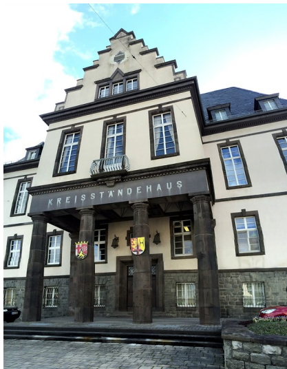
Das Kreisständehaus der Kreisverwaltung Altenkirchen (2015).