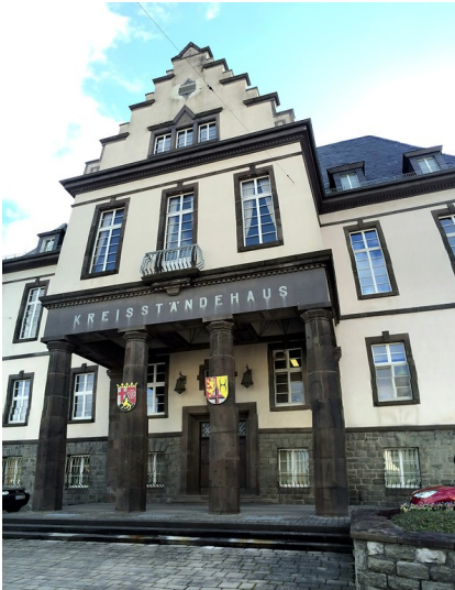
Das Kreisständehaus der Kreisverwaltung Altenkirchen (2015).