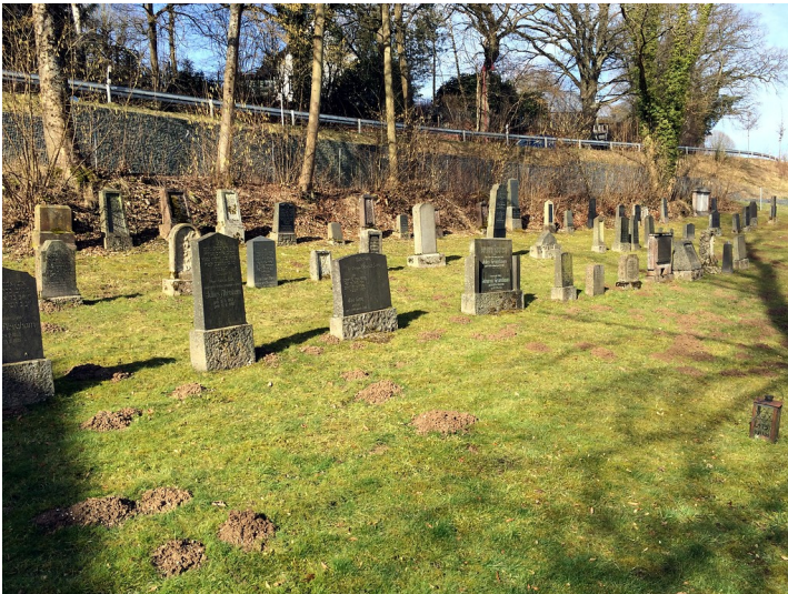
Jüdischer Friedhof Kumpstraße in Altenkirchen, die letzten übrig gebliebenen Grabmäler (2015)