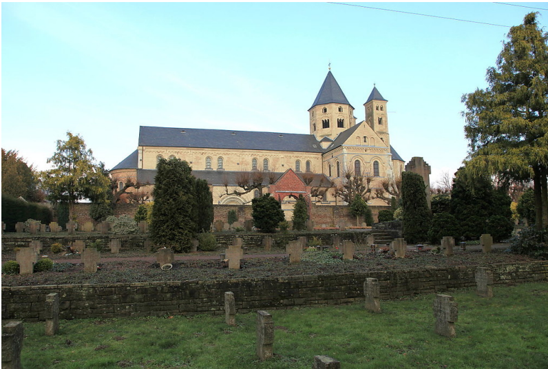
Kloster Knechtsteden bei Dormagen, Gesamtansicht von Kloster, Klosterfriedhof und Basilika (2013).