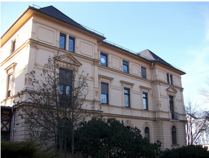
Jacoby'sche Anstalt in Bendorf-Sayn (2015)