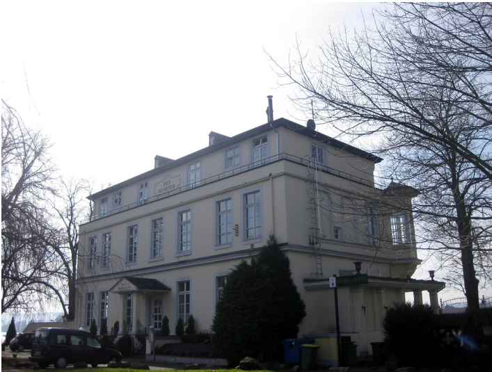
Gesamtansicht des Hauses Bucheneck am Donaupark in Linz am Rhein (2015).