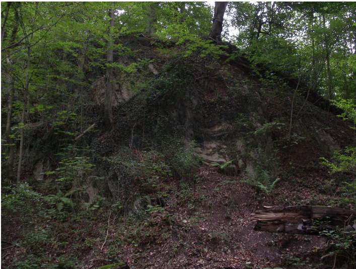
Steinbruch Neue Dombach