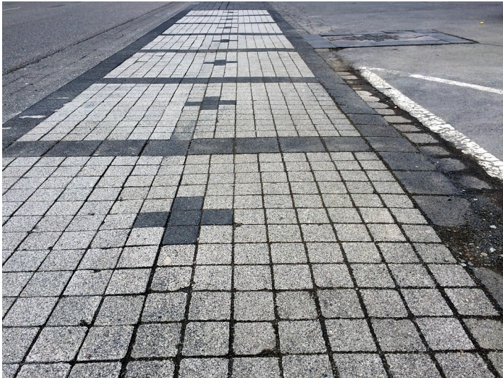
Markierung im Pflaster der Frankfurter Straße in Altenkirchen ("Sieben Gedenksteine") am früheren Standort Synagoge Altenkirchen in der damaligen Mackenstraße (2015).