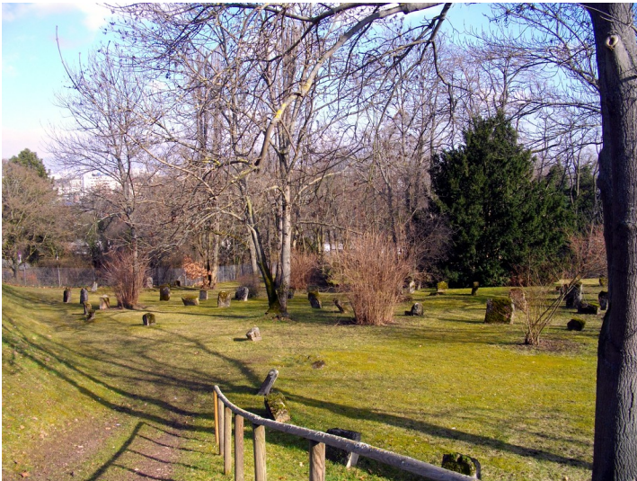
Grabsteine auf dem Denkmalfriedhof am "Judensand" in Mainz (2015)