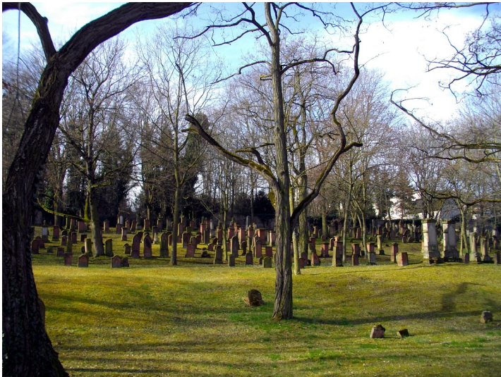
Gräberfeld auf dem jüdischen Friedhof "alter Judensand" in Mainz (2015)