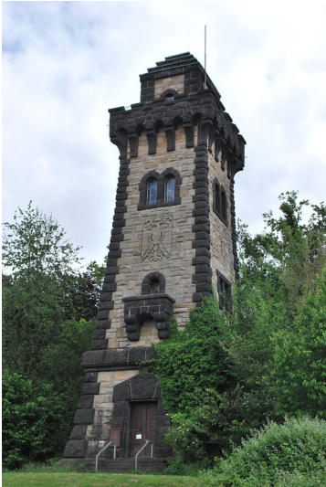
Der Bismarckturm ist ein Aussichtsturm, der seit 1908 hoch über dem Ruhrufer bei Mülheim steht. Auffällig ist seine burgenartige Architektur. Er ist aus Sandstein erbaut (2015).