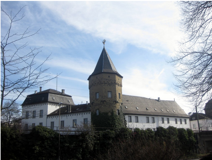
Gesamtansicht der Linzer Burg in Linz am Rhein (2015).