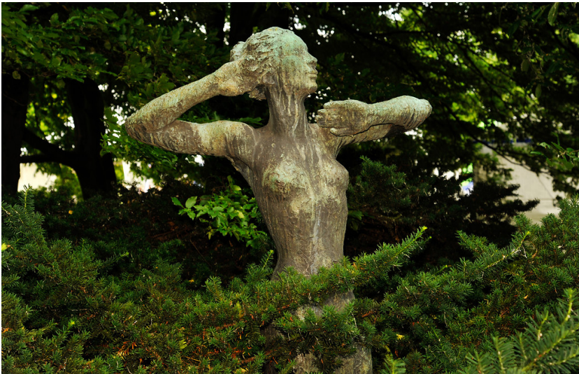
Skulptur "Die Schauende" im Rheinpark in Köln-Deutz (2013)