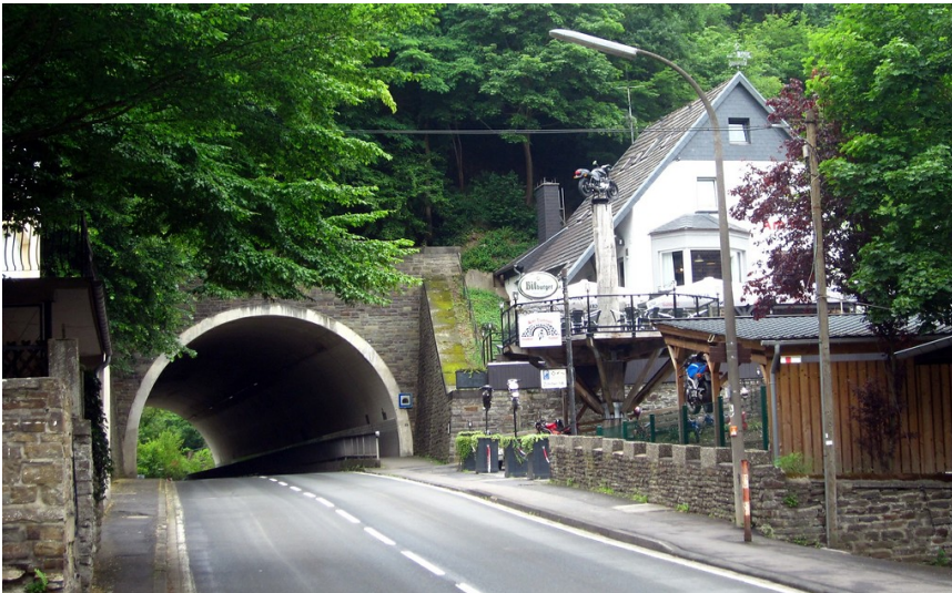
Östliche Einfahrt in den Engelslay-Tunnel an der Bundesstraße B 267 bei Altenahr (2015).