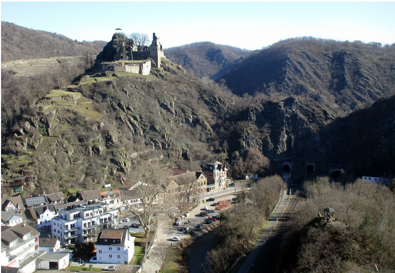
Blick vom Aussichtspunkt "Schwarzes Kreuz" auf die Burgruine Are sowie die drei benachbarten Wander-/Fahrrad-, Eisenbahn- und Straßentunnel ("Engelslay-Tunnel") im Tal bei Altenahr im Landkreis Ahrweiler (2021).