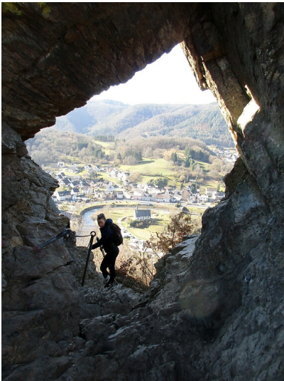
Blick durch die Felsformation "Teufelsloch" hinunter auf den Ort Altenahr-Altenburg mit der Kapelle St. Maternus (2021).