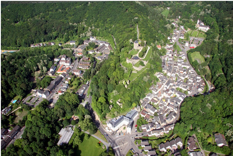
Ein Luftbild von Sayn mit Blick nach Osten auf den Strombergsporn mit der Burg Sayn (2009).