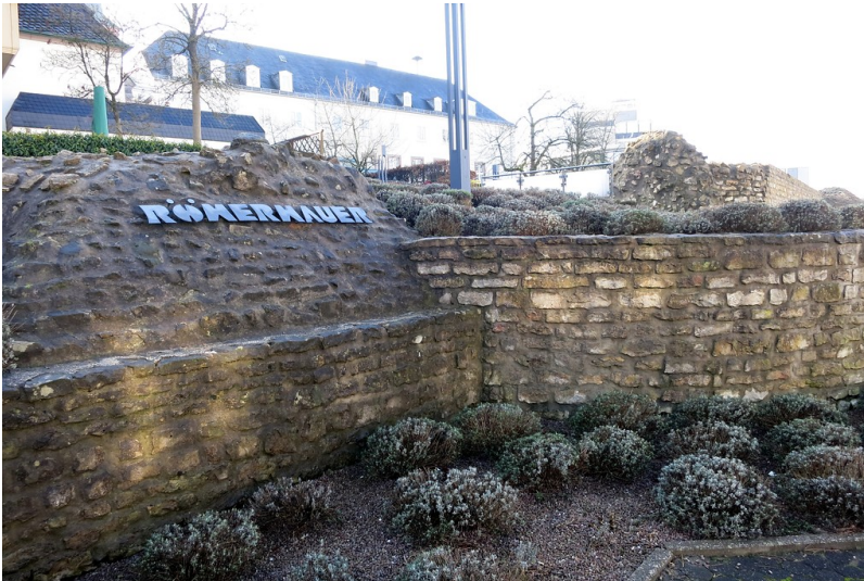
Reste der römischen Stadtmauer in Bitburg (2015).