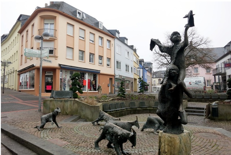
Der Brunnen "De Beberiger Gäßestrepper" in Bitburg (2015)