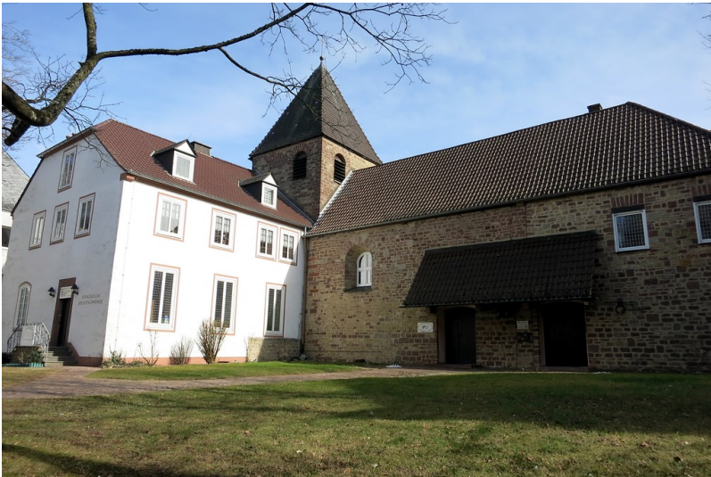
Die evangelische Kirche in der Trierer Straße in Bitburg (2015)