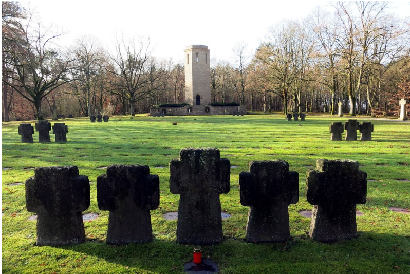
Der Ehrenfriedhof und die Kriegsgräberstätte Kolmeshöhe bei Bitburg (2015).