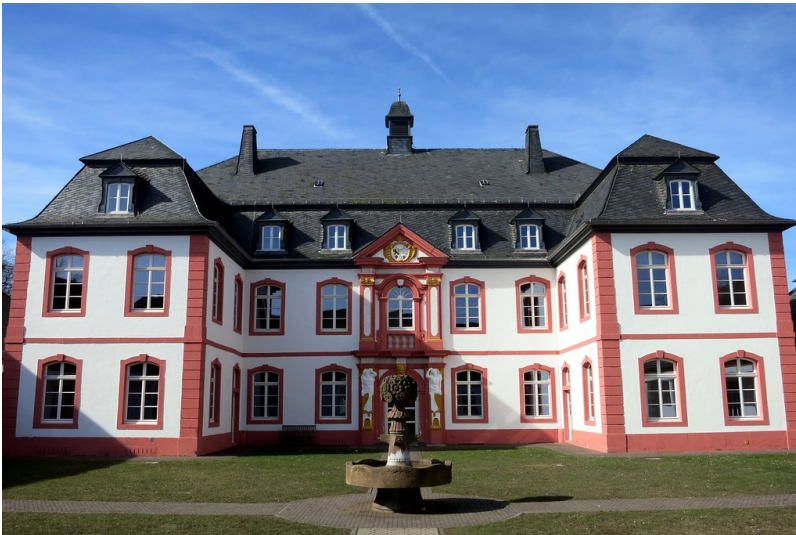
Der zentrale Bau des Barockschlosses Bitburg (2015)