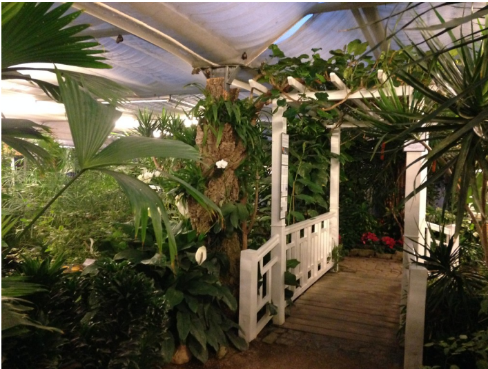
Eine Brücke und Pfade im Sayner Schmetterlingsgarten (2014)