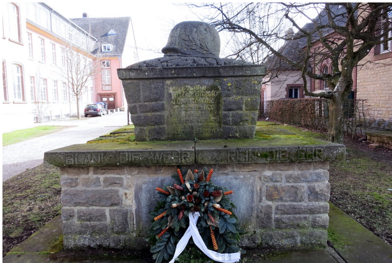
Kriegerdenkmal am Alten Gymnasium in der Trierer Straße in Bitburg (2015).