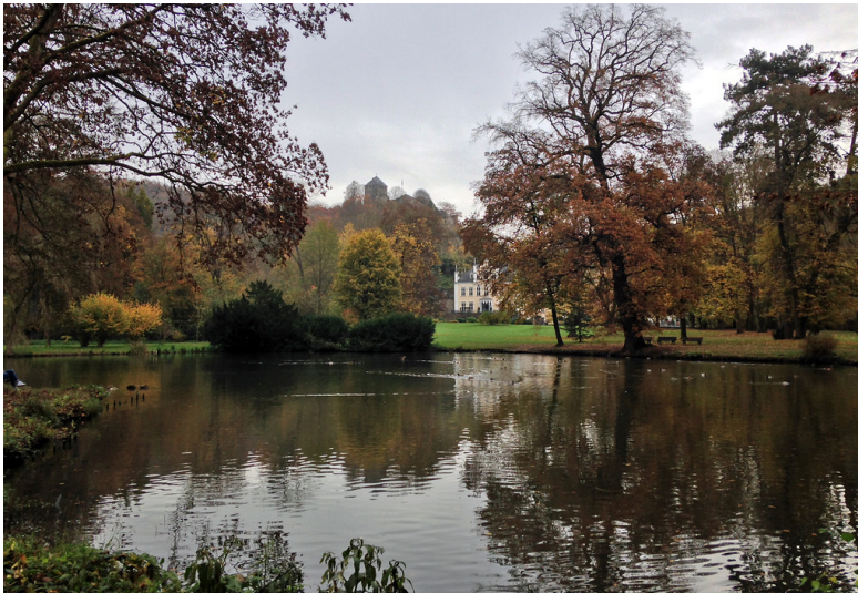
Blick nach Osten über den Sayner Schlosspark mit Teich (2014); im Hintergrund sieht man Schloss Sayn am Fuß des Strombergsporns und Burg Sayn auf dem Burgberg.