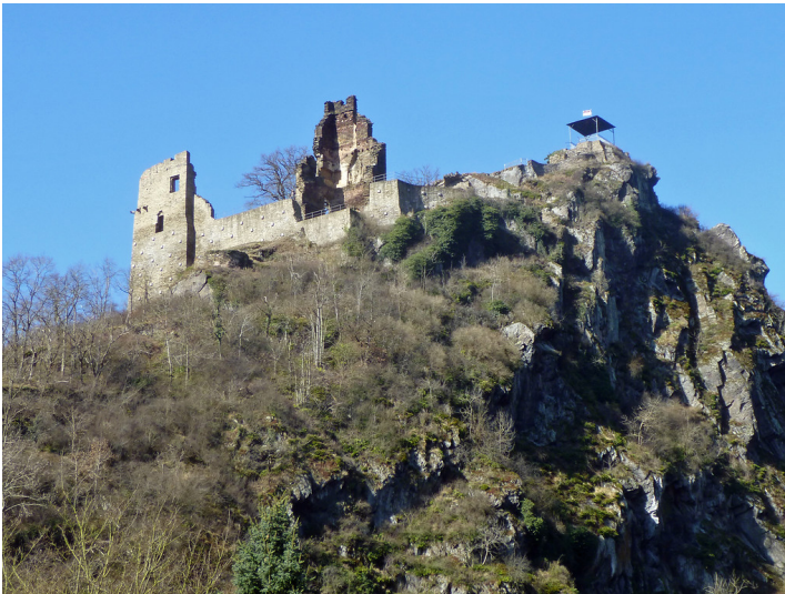
Ansicht der Burgruine Are bei Altenahr (2015).