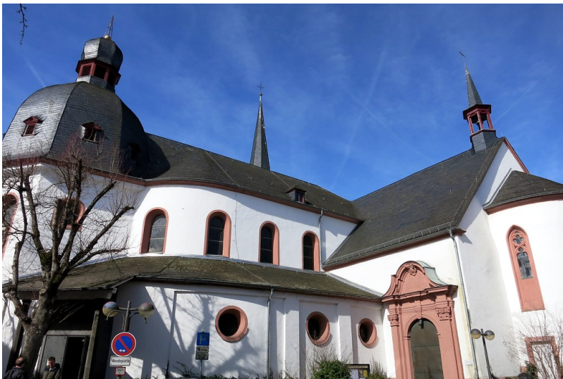
Die älteste Kirche Bitburgs, die Pfarrkirche Liebfrauen (2015)