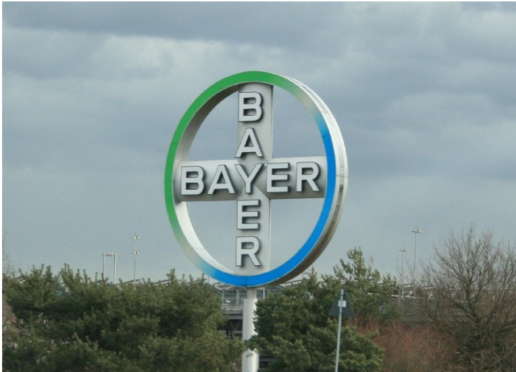
Das Bayer-Kreuz im Bereich der Anfahrt zum Flughafen Köln/Bonn über die Landstraße L 84 (2015).