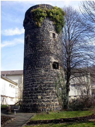
Der Pulverturm am Rheinufer in Linz - einer von vier Türmen, welche die Ecken der damaligen Stadtmauer bildeten (2015).