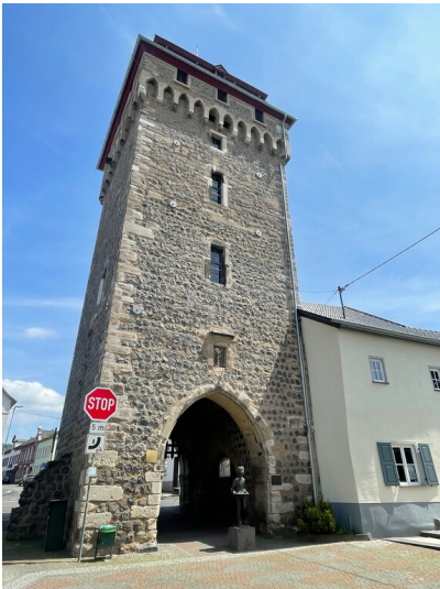
Neutor in Linz am Rhein