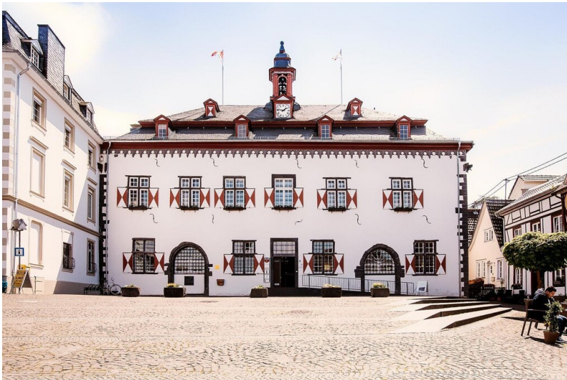
Historisches Rathaus in Linz am Rhein (2017)